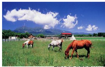
野辺山高原・滝沢牧場(イメージ)