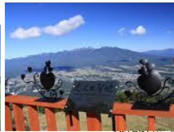
入笠山展望台(イメージ)