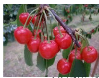
さくらんぼ(イメージ)