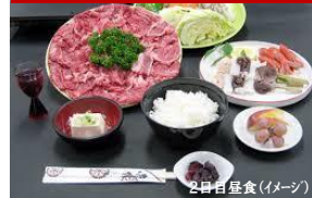
2日目昼食(イメージ)