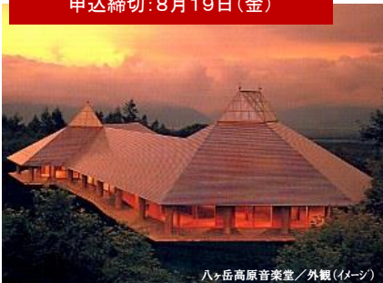
八ヶ岳高原音楽堂/外観(イメージ)