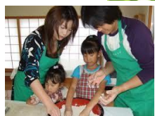
そば打ち体験(イメージ)