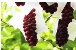
ぶどう狩り(イメージ)